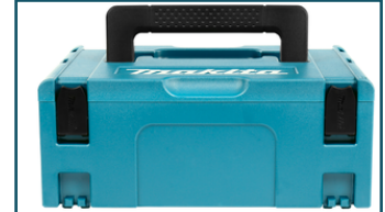
Mbox nr.2 (1 stuks) - 821550-0 - 0088381430128