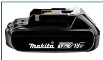
Accu BL1815N LXT 18V 1,5Ah (1 stuks) - 196235-0 - 0088381417556