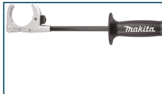
Zijhandgreep (1 stuks) - 126412-0 - 3240890411969