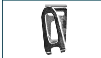
Draaghaak lang (1 stuks) - 346317-0 - 0088381374194