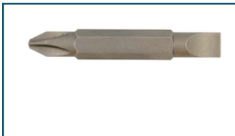
Schroefbit SI-PH2 (1 stuks) - 784637-8 - 0088381140904