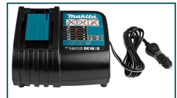
Auto oplader LXT DC18SE (1 stuks) - 194622-7 - 0088381349673

Dit is slechts een kleine greep uit het ruime assortiment. Kijk voor alle accessoires/verbruiksartikelen in de Catalogus of op www.makita.nl .