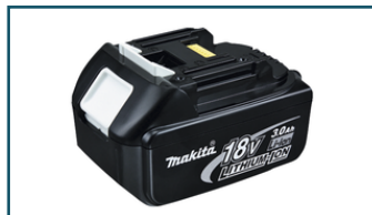
Accu BL1830 LXT 18V 3,0Ah (1 stuks) - 193533-3 - 0088381367004