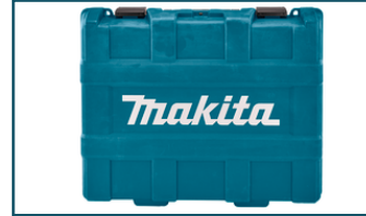
Koffer (1 stuks) - 821568-1 - 0088381437516