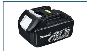
Accu BL1830 LXT 18V 3,0Ah (1 stuks) - 193533-3 - 0088381367004