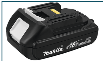
Accu BL1815 LXT 18V 1,3Ah (1 stuks) - 195445-6 - 0088381367455