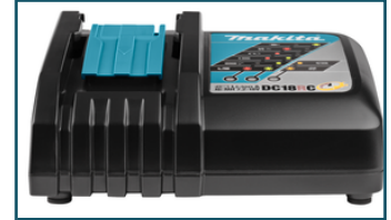
Oplader LXT DC18RC (1 stuks) - 195584-2 - 0088381373562