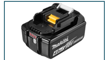
Accu BL1840B LXT 18V 4,0Ah (1 stuks) - 197265-4 - 0088381459068

Dit is slechts een kleine greep uit het ruime assortiment. Kijk voor alle accessoires/verbruiksartikelen in de Catalogus of op www.makita.nl .