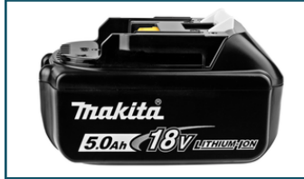
Accu BL1850B LXT 18 V 5,0Ah (2 stuks) - 197280-8 - 0088381459129