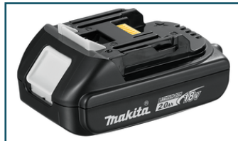
Accu BL1820 LXT 18V 2,0Ah (1 stuks) - 196462-9 - 0088381430876