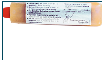
Boor- en beitelvet 100ml tube (1 stuks) - 181573-3 - 0088381116619