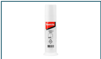
Boor- en beitelvet 100ml dispenser (1 stuks) - 198993-4 - 0088381518994