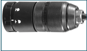
Boorkop snelspan 1,5-13mm (1 stuks) - 194079-2 - 0088381196826