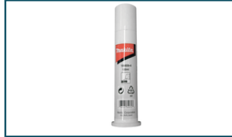
Boren/beitelvet 100ml disp. (1 stuks) - 194683-7 - 0088381349703