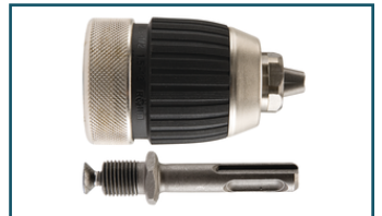
Boorkop snelspan 1,5-13mm SDS-PLUS (1 stuks) - P-33788 - 0088381961943

Dit is slechts een kleine greep uit het ruime assortiment. Kijk voor alle accessoires/verbruiksartikelen in de Catalogus of op www.makita.nl .