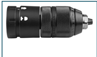
Boorkop snelspan 1,5-13mm (1 stuks) - 199139-5 - 0088381525695