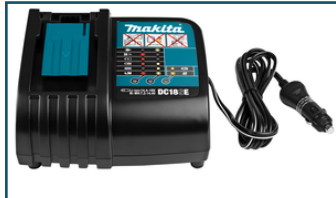
Auto oplader LXT DC18SE (1 stuks)