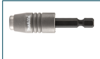
Bithouder 1/4" 60mm (1 stuks)