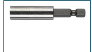
Bithouder 1/4"x60mm magneet (1 stuks)