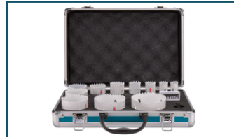
Gatzaagset 14-dlg wit (1 stuks) - D-47298 - 0088381424370