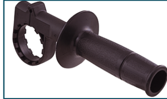
Zijhandgreep (1 stuks) - 135302-6 - 0088381364430