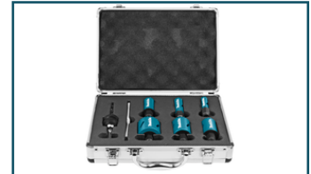
Gatzaagset 8-dlg bl. E-inst. (6 stuks) - B-11972 - 0088381353700

Dit is slechts een kleine greep uit het ruime assortiment. Kijk voor alle accessoires/verbruiksartikelen in de Catalogus of op www.makita.nl .