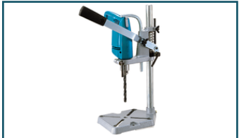
Boorstandaard Euronorm 43 (1 stuks) - A-36712 - 0088381183154