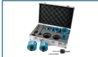
Gatzaagset 10-dlg bl. E-inst. (6 stuks) - B-18188 - 0088381372329